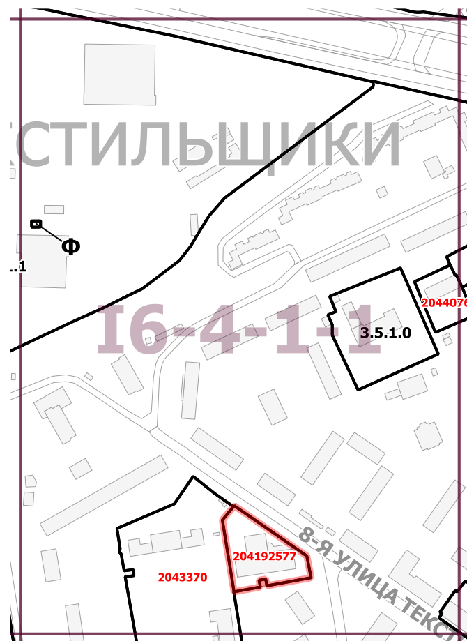
Границы территориальных зон, подзон территориальных зон и предельные параметры разрешенного строительства, реконструкции объектов капитального строительства